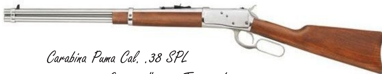
Carabina Puma Cal. .38 SPL